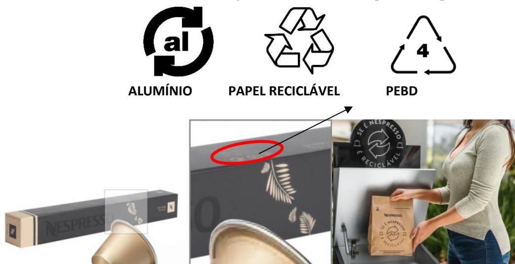
Figura 2 - Reciclagens da embalagem Nespresso + cápsula

Os materiais que são identificados por símbolos estabelecidos pela norma nesse caso são: polímeros, alumínio e papel. Os plásticos possuem identificação mais específica, com relação ao polímero usado. A simbologia brasileira, estabelecida pela ABNT NBR 16182/2013 é apresentada. Conforme Figura 3.