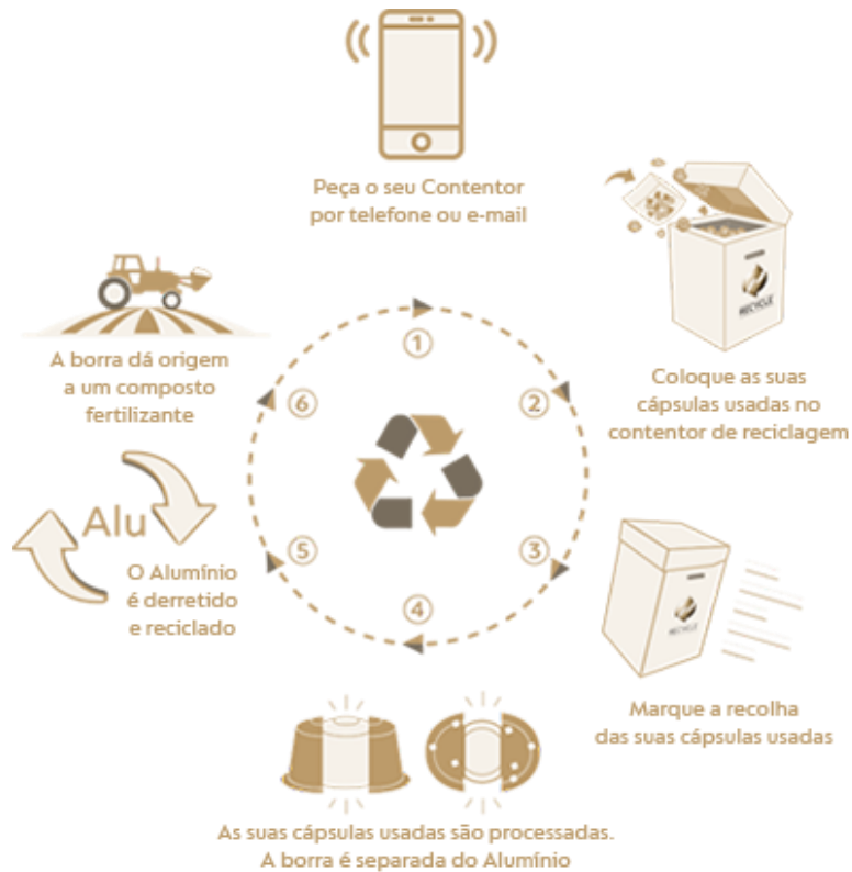
Figura 4 – Processo de reciclagem profissional da NESPRESSO

em 660°C, - Resistência à tração em 89 Mpa, - Tensão de escoamento em 24 Mpa, sua Deformação em 25% dados apresentados pela (NESPRESSO ALUMINIO, 2023).