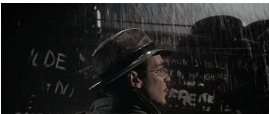
Figura 2: Frame do prólogo de “Europa”.

Em relação a este objeto de montagem, é possível notar que o prólogo de “Europa” se constitui de um único plano com fragmentos, sendo transformados pela narração, em que a velocidade do trem varia de acordo com a contagem do narrador. Há também, no fim do prólogo, a fragmentação pelos parâmetros visuais, pois, nessa primeira apresentação de Leopold, suas cores aparecem com saturação, enquanto o cenário permanece sem saturação. O recurso visual, neste sentido, mais do que atender uma necessidade estritamente tecnológica, promove “uma perspectiva de intensificação de uma experiência com o movimento” (FURTADO, 2013, p. 17).